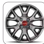
Jantes alliage 15" De série sur 4x4 Rock