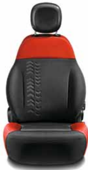
POP Tissu rouge/noir Surpiqûres grises