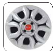
Enjoliveurs 14" De série sur motorisation GNV