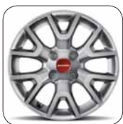
Enjoliveurs 14" De série sur Pop