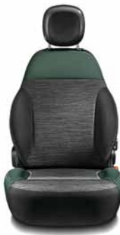
4X4 ROCK Tissu gris/Écocoir vert Surpiqûres grises