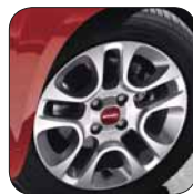
Jantes alliage 14" De série sur Lounge En option sur Pop et Easy