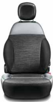
4X4 ROCK Tissu gris/Écocoir gris Surpiqûres vertes