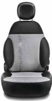
EASY/LOUNGE Tissu gris/noir Surpiqûres grises