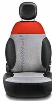
EASY/LOUNGE Tissu rouge/noir Surpiqûres rouges