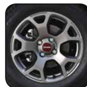
Jantes alliage 15" De série sur 4x4 Cross