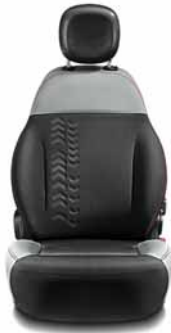
POP Tissu gris/noir Surpiqûres rouges