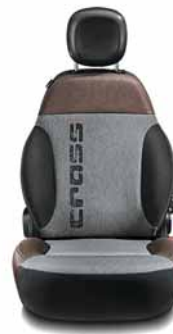
4X4 CROSS Tissu gris/Écocoir marron cuivré Surpiqûres grises