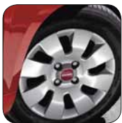
Enjoliveurs 14" De série sur Panda