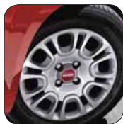
Enjoliveurs 14" De série sur Easy