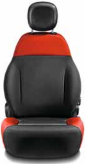
PANDA Tissu rouge/noir