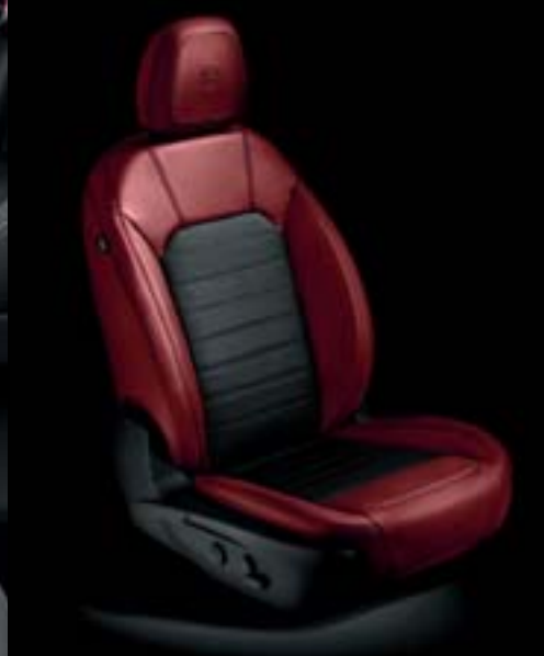
Sièges avec sellerie mixte Alfatec / tissu noir et rouge