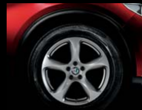
208 - Jantes en alliage 18" Super Scuro