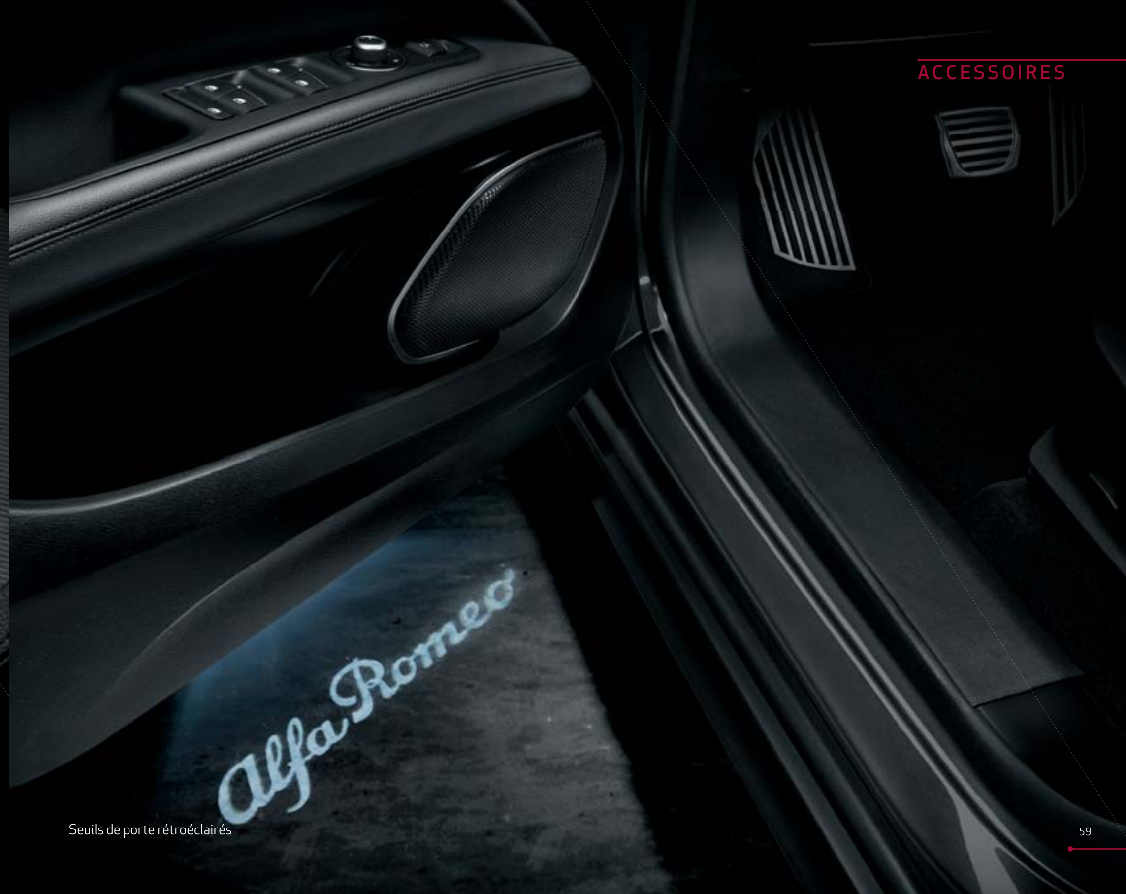
Seuils de porte rétroéclairés