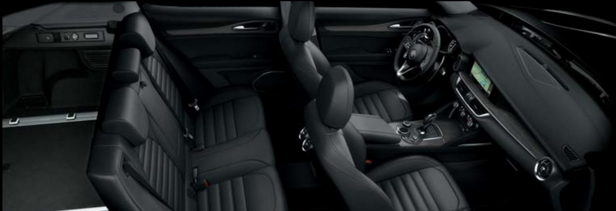
Tableau de bord avec finitions chêne foncé - Sièges cuir pleine fleur noir