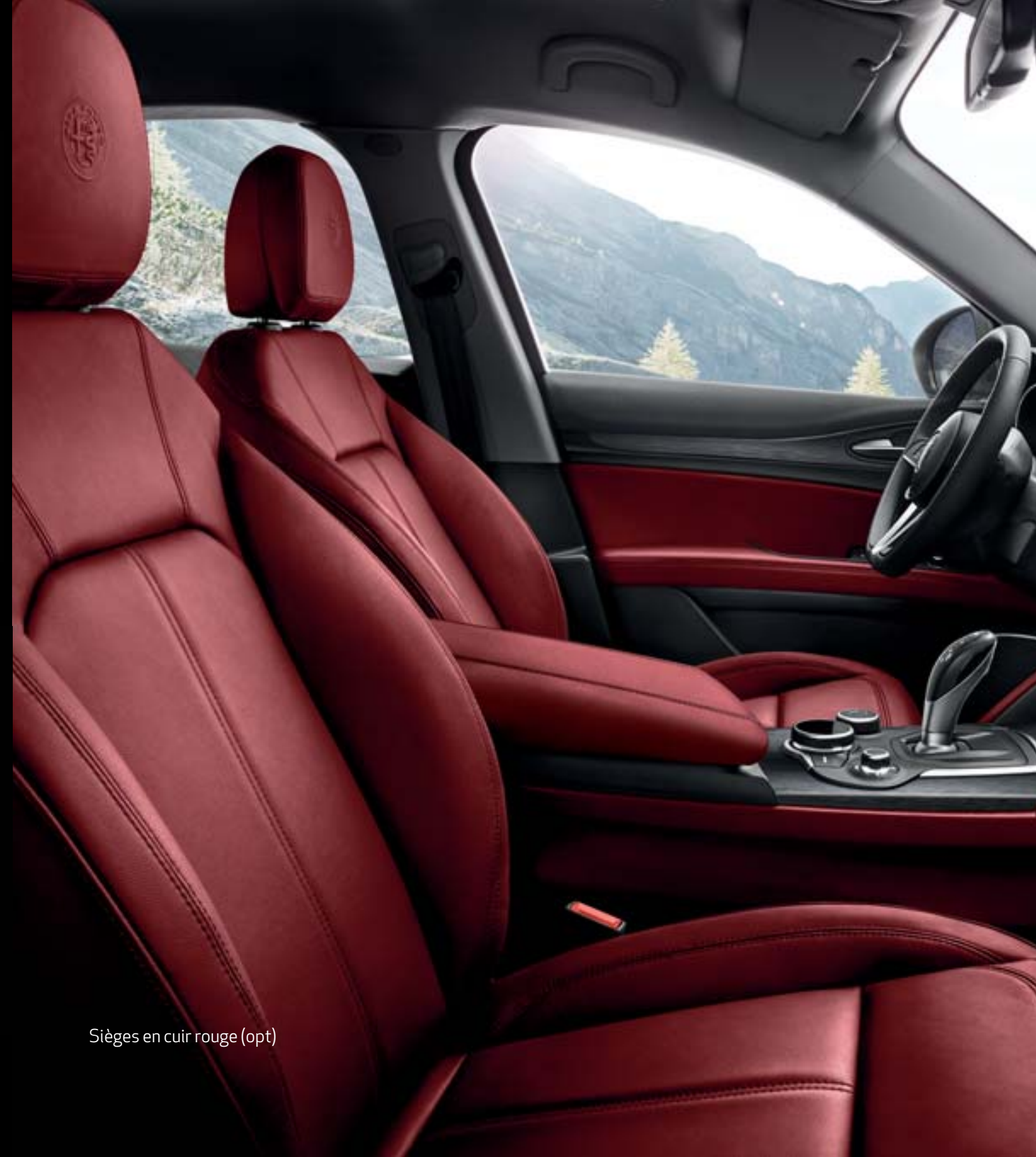
Sièges en cuir rouge (opt)