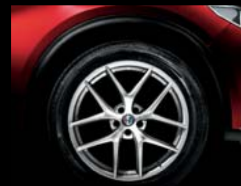
5A6 - Jantes en alliage 20" First Edition