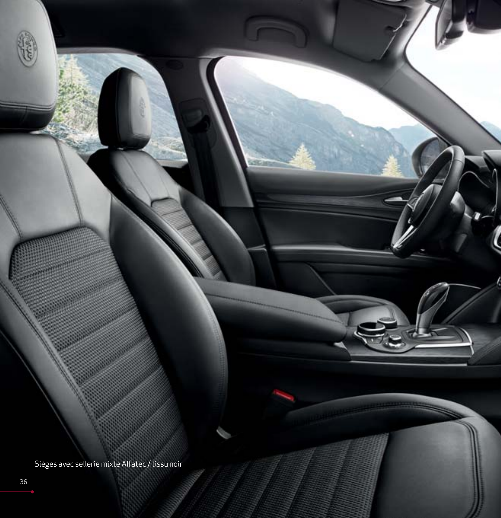
Sièges avec sellerie mixte Alfatec / tissu noir