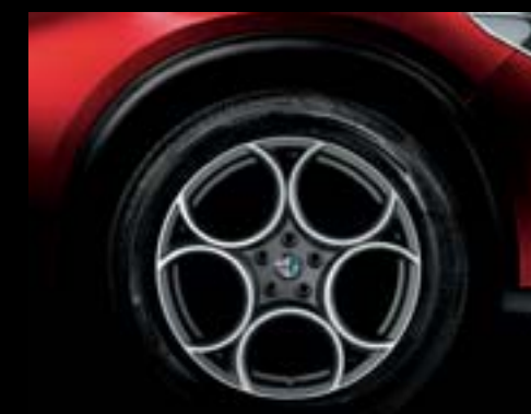
5EV - Jantes en alliage 19" Competizione