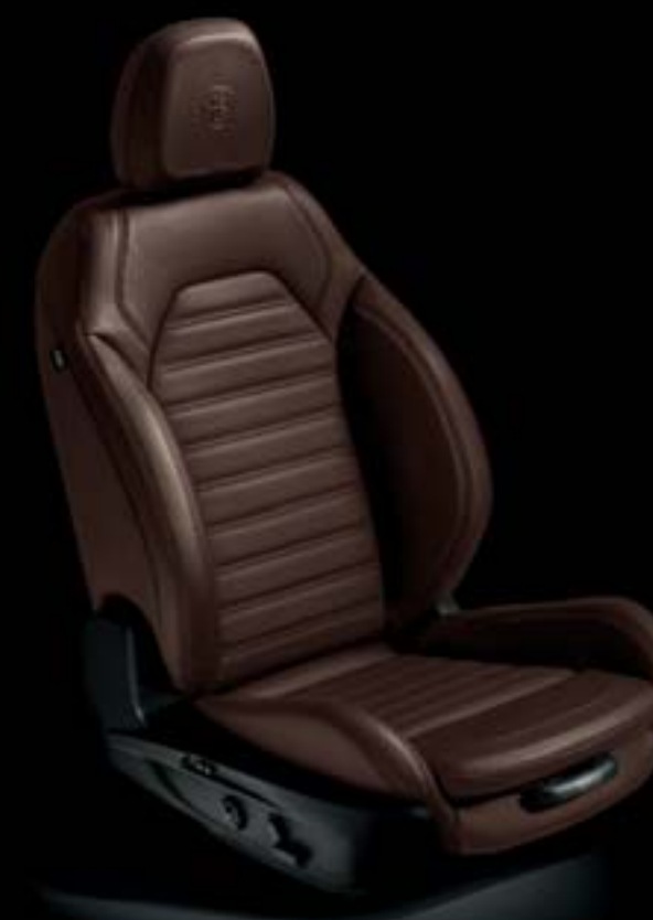
Sièges sport en cuir tabac