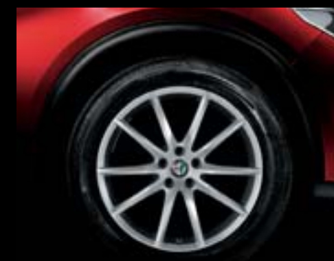
5FB - Jantes en alliage 19" Veloce