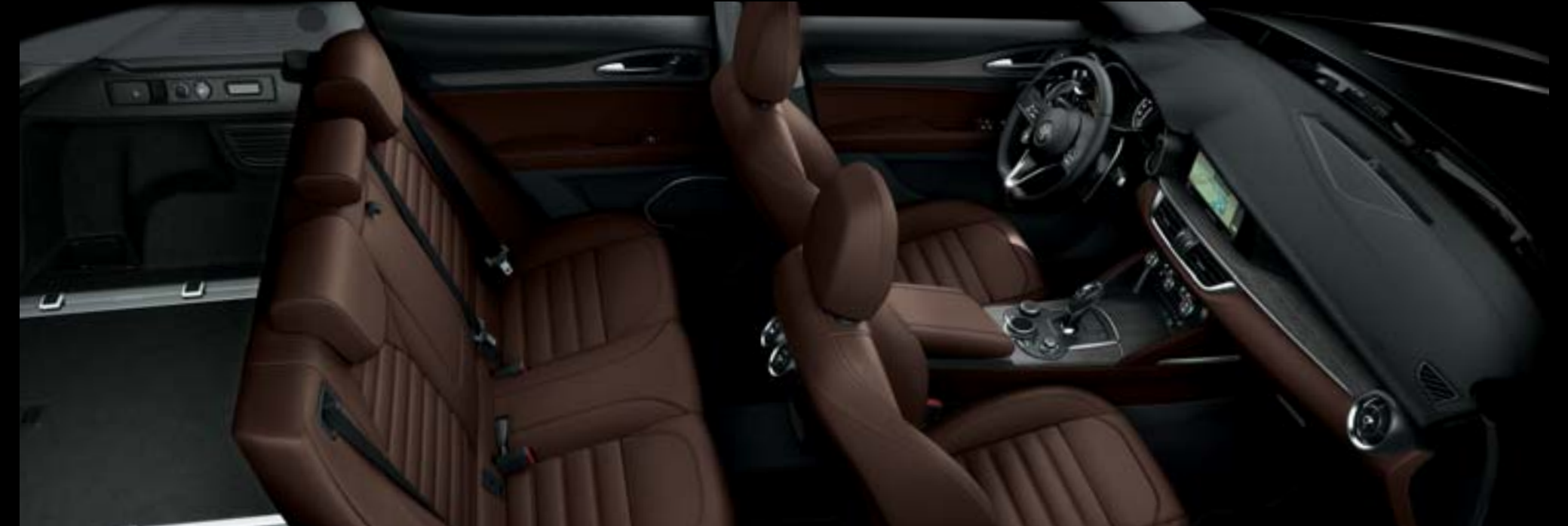
Tableau de bord avec finitions chêne foncé - Sièges cuir pleine fleur tabac