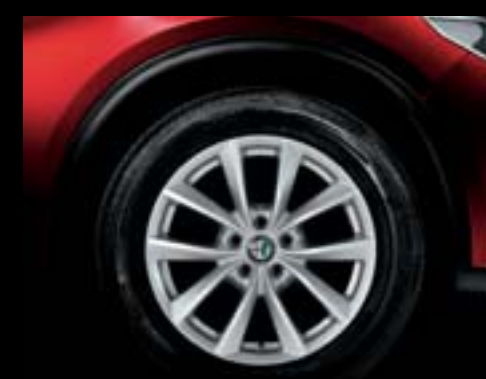
421 - Jantes en alliage 17" Luxury