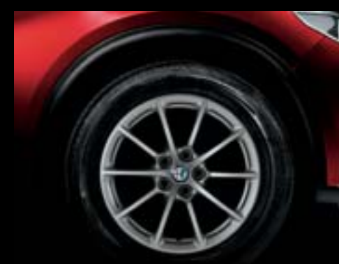
108 - Jantes en alliage 17" Stelvio Scuro