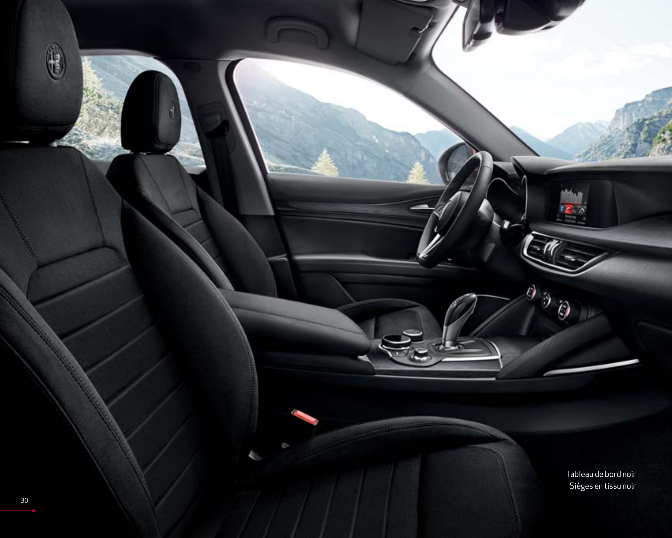
Tableau de bord noir Sièges en tissu noir