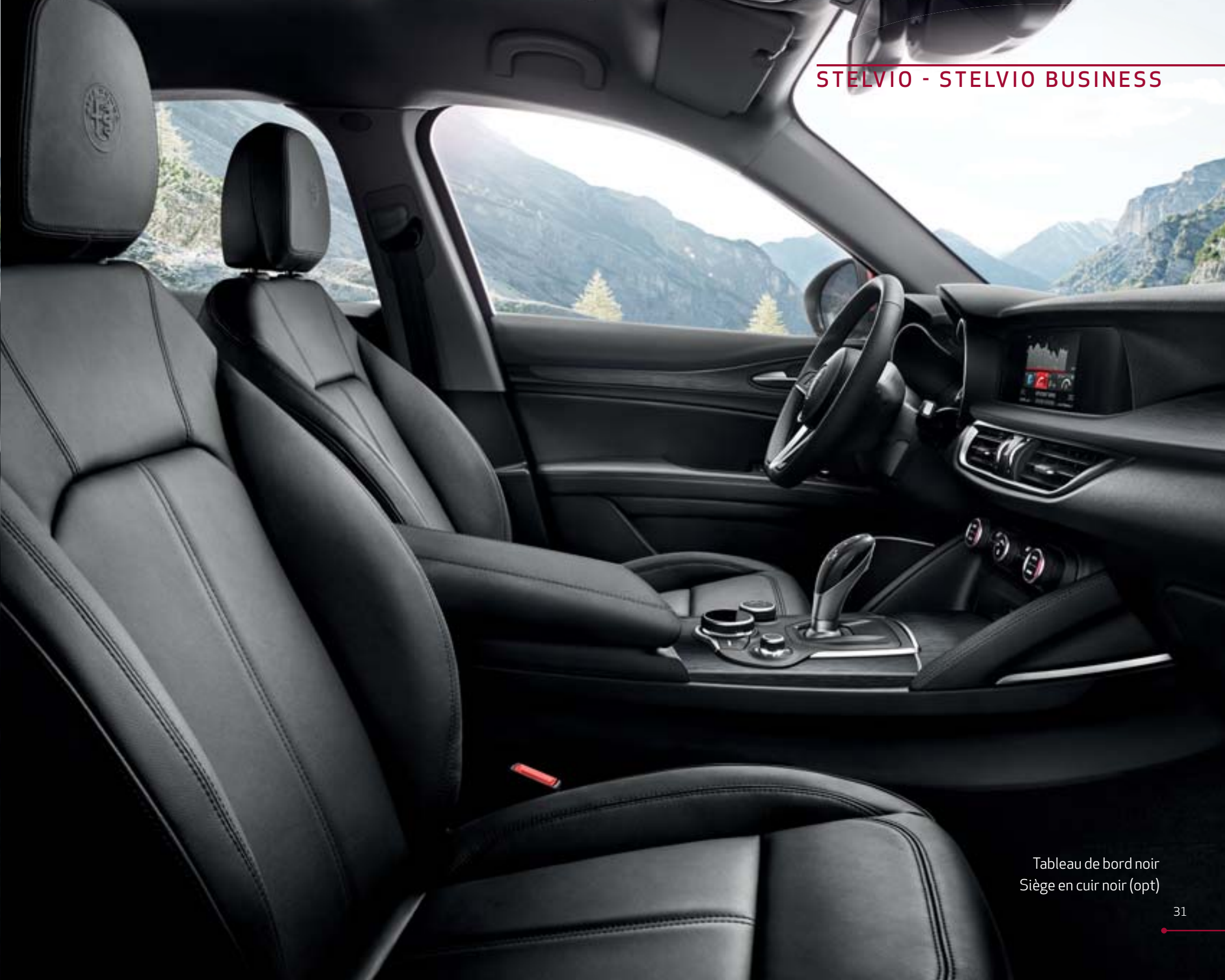
Tableau de bord noir Siège en cuir noir (opt)