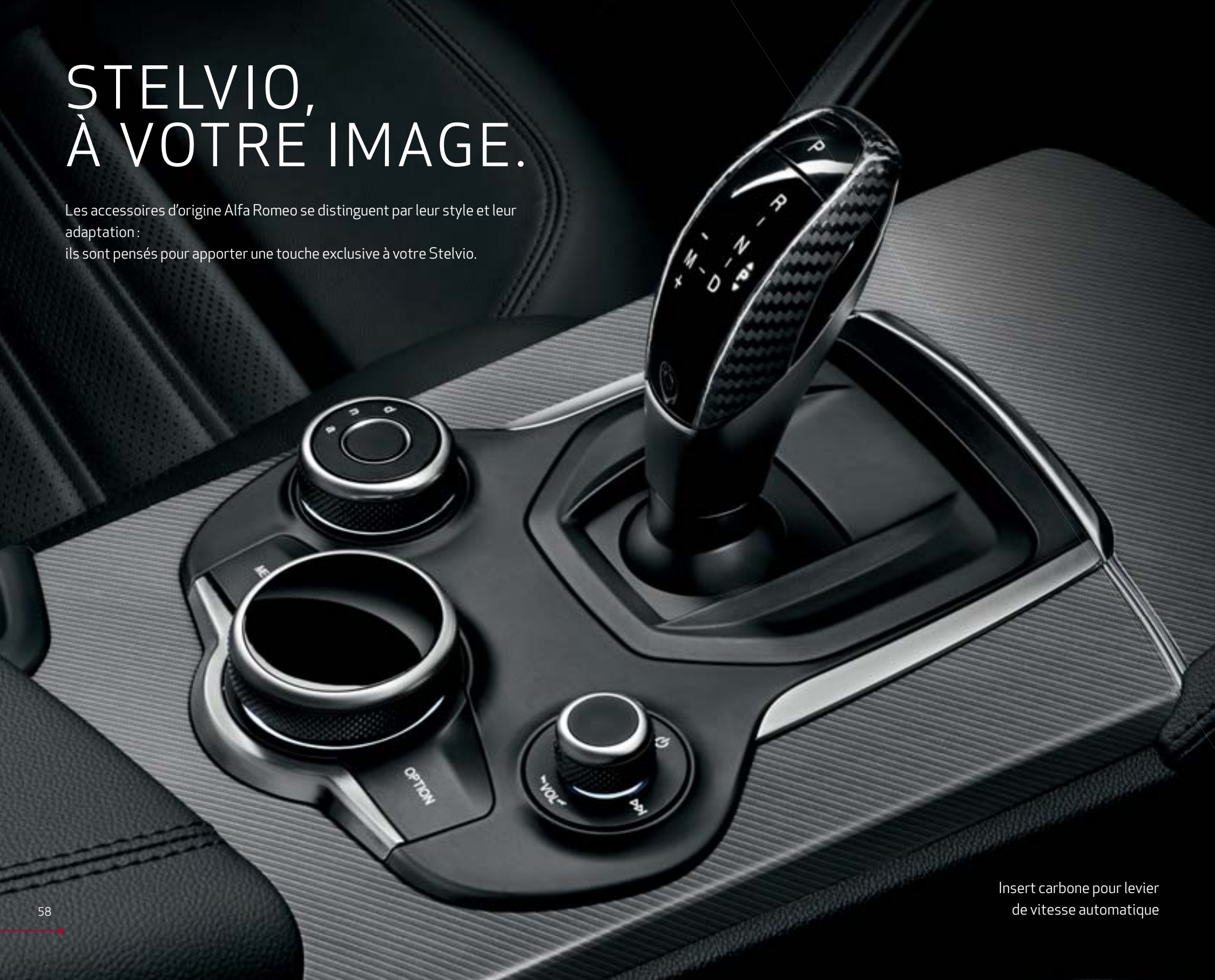
Insert carbone pour levier de vitesse automatique

Les accessoires d'origine Alfa Romeo se distinguent par leur style et leur adaptation : ils sont pensés pour apporter une touche exclusive à votre Stelvio.