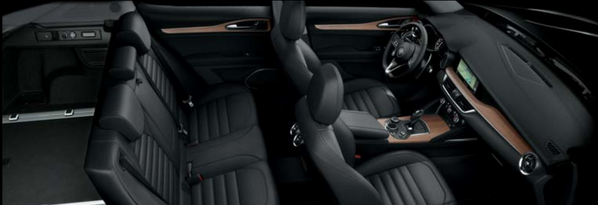
Tableau de bord avec finitions noyer clair - Sièges cuir pleine fleur noir