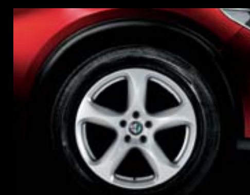
4AY - Jantes en alliage 18" Super