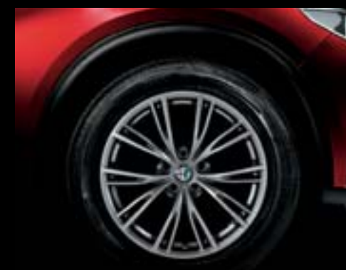
4WQ - Jantes en alliage 18" Luxury