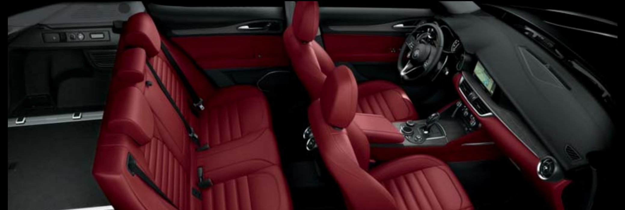
Tableau de bord avec finitions chêne foncé - Sièges cuir pleine fleur rouge