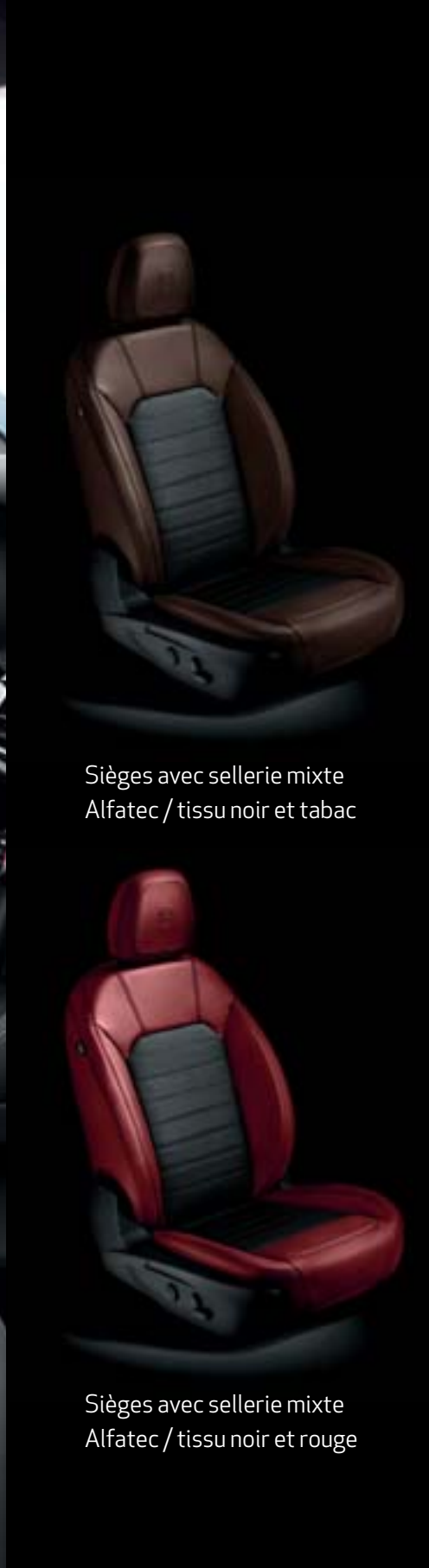
Sièges avec sellerie mixte Alfatec / tissu noir et tabac