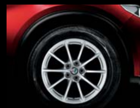
420 - Jantes en alliage 17" Stelvio