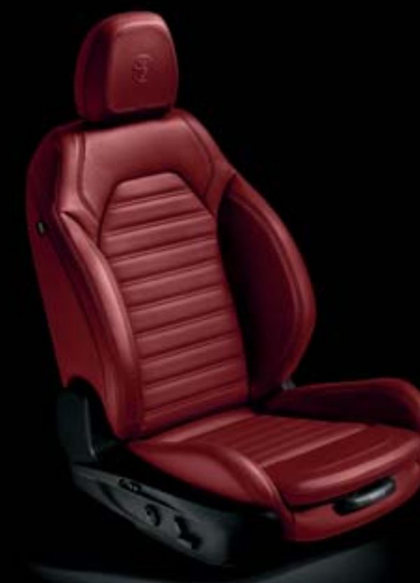
Sièges sport en cuir rouge