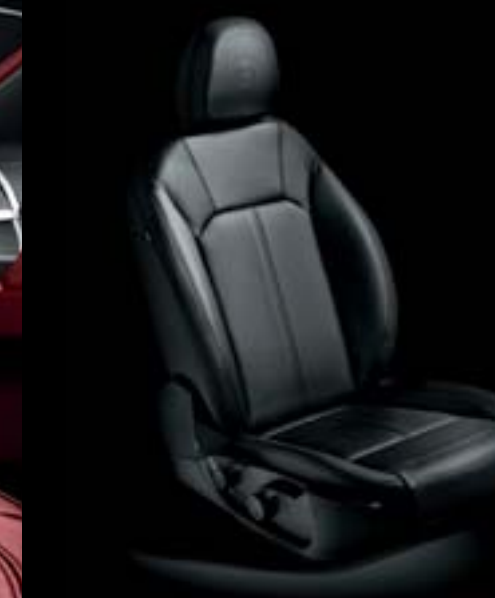
Siège en cuir noir (opt)