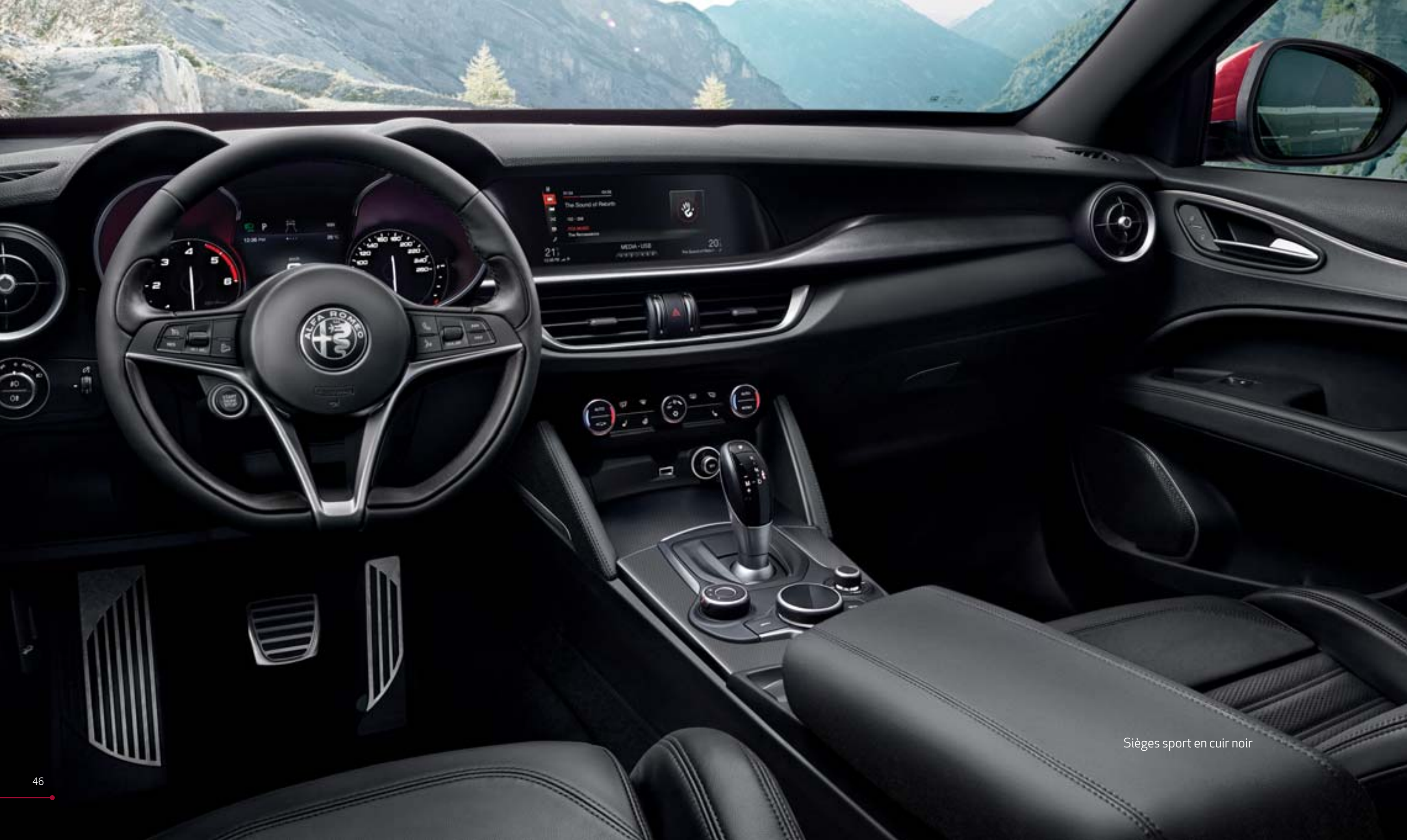
Sièges sport en cuir noir